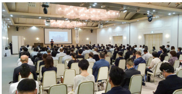
(会長研修会の様子)