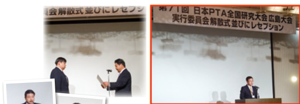
大会にご協力いただいた皆さまに 本当にありがとうございました！