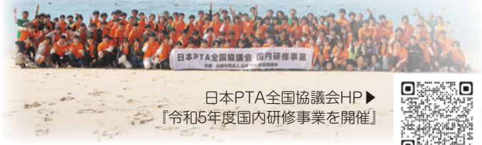
日本PTA全国協議会HP ▶ 『令和5年度国内研修事業を開催』